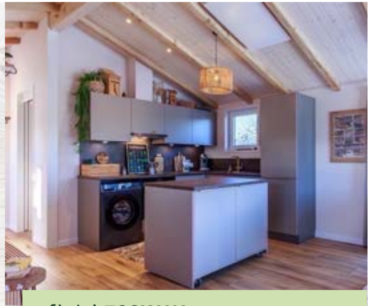
Chalet TOSKANA Zeitlos – Grau

Die Farbgestaltung ist dabei völlig frei wählbar und orientiert sich an unserer umfangreichen Musterkollektion. Ob modern in elegantem Hochglanzweiß, zeitlos und stilvoll in dunklem Grau oder mit skandinavischem Statement in tiefem Schwarz, nahezu jede Designidee lässt sich realisieren und auf das jeweilige Chalet abstimmen.