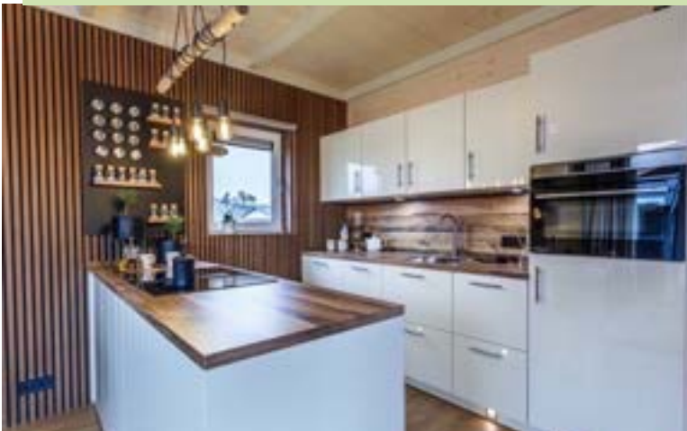
Chalet NORWEGEN DELUXE Modern – Hochglanzweiß