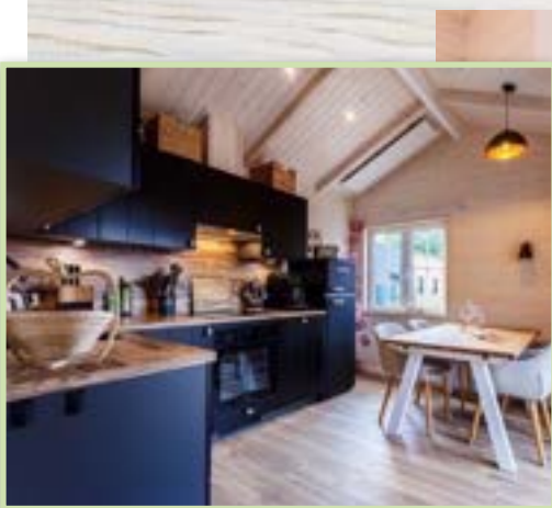
Chalet GRÖNLAND Skandinavisch - Schwarz