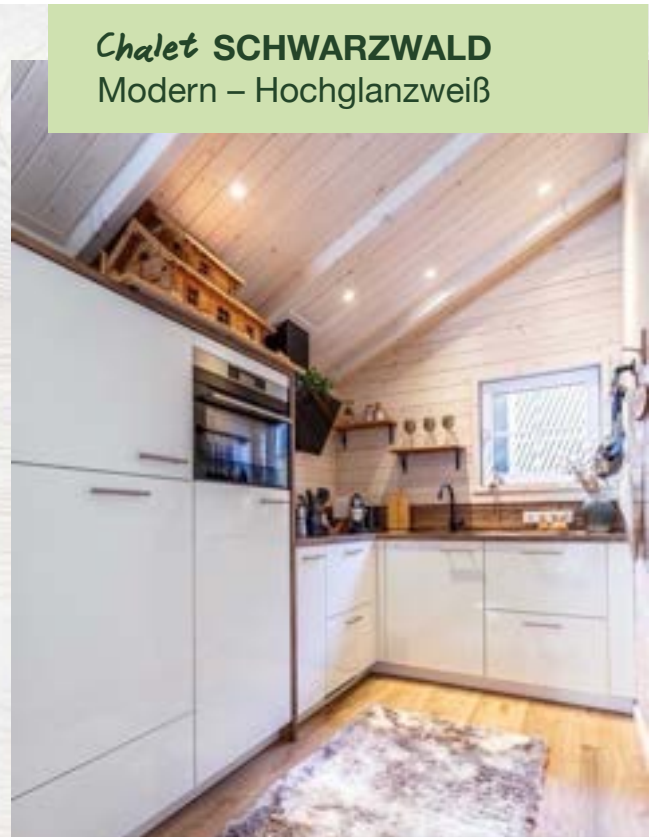
Chalet SCHWARZWALD Modern – Hochglanzweiß