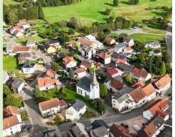
Idyllisches Dorf im Herzen des St. Wendeler Landes