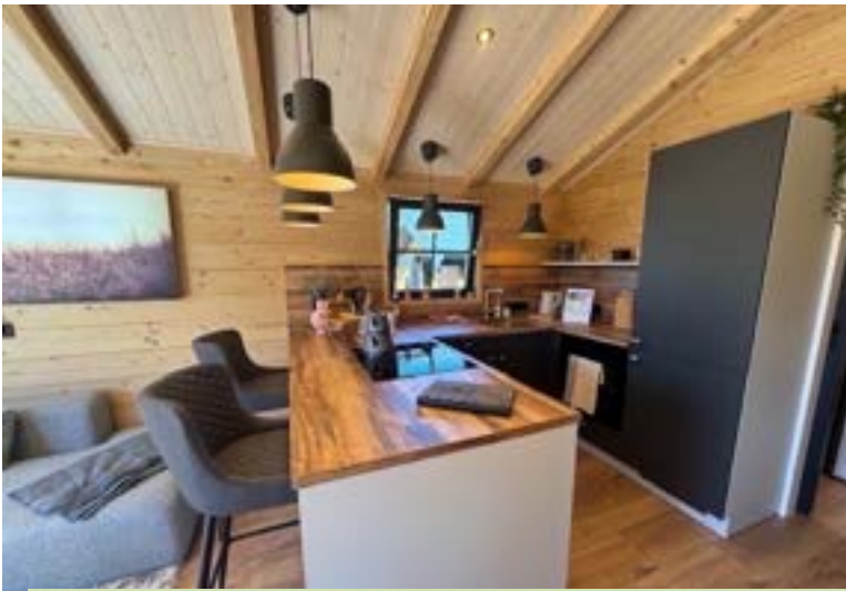
Chalet ÖSTERREICH Zeitlos – Anthrazit