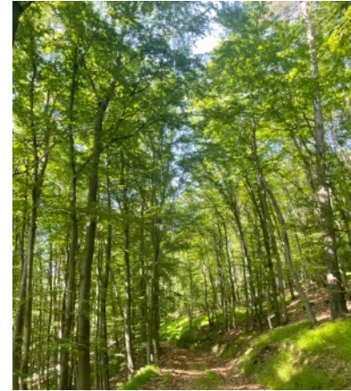
Habichtswald (10 min. Fußweg von den Grundstücken)

Weitere Supermärkte, Apotheken, Restaurants und andere Geschäfte sind in nur fünf Autominuten erreichbar.