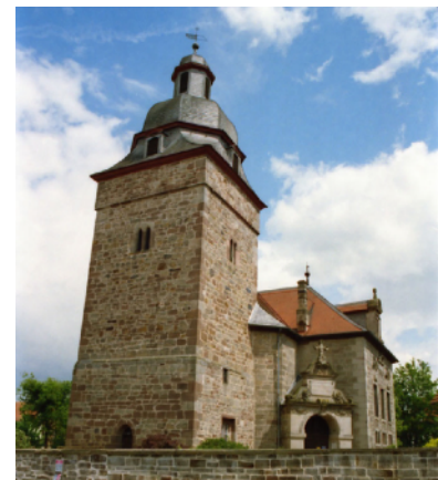
gotische denkmalgeschützte Kirche in Balhorn