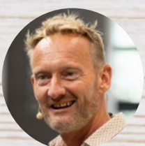
Sven Tietzer TV-Moderator