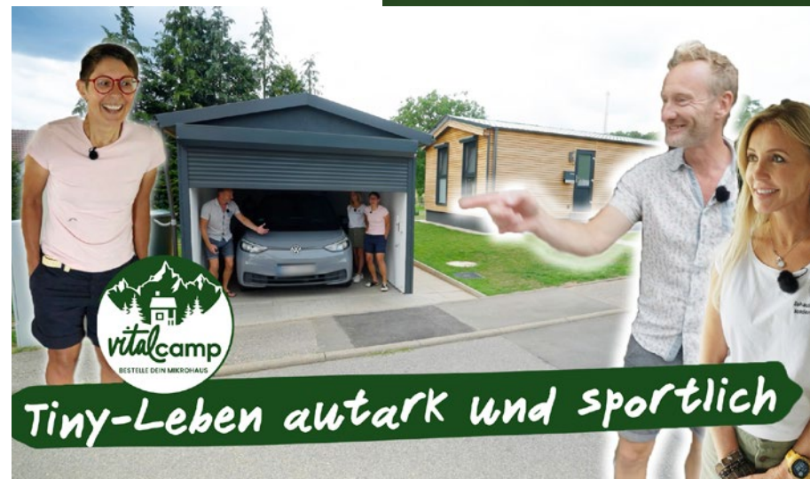
Tiny-Leben autark und sportlich