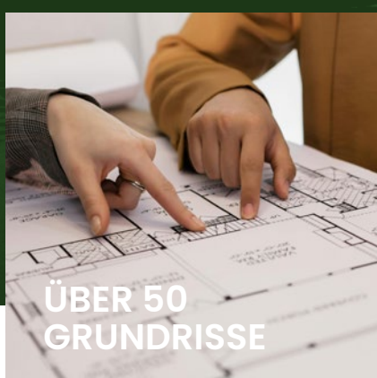
ÜBER 50 GRUNDRISSSE