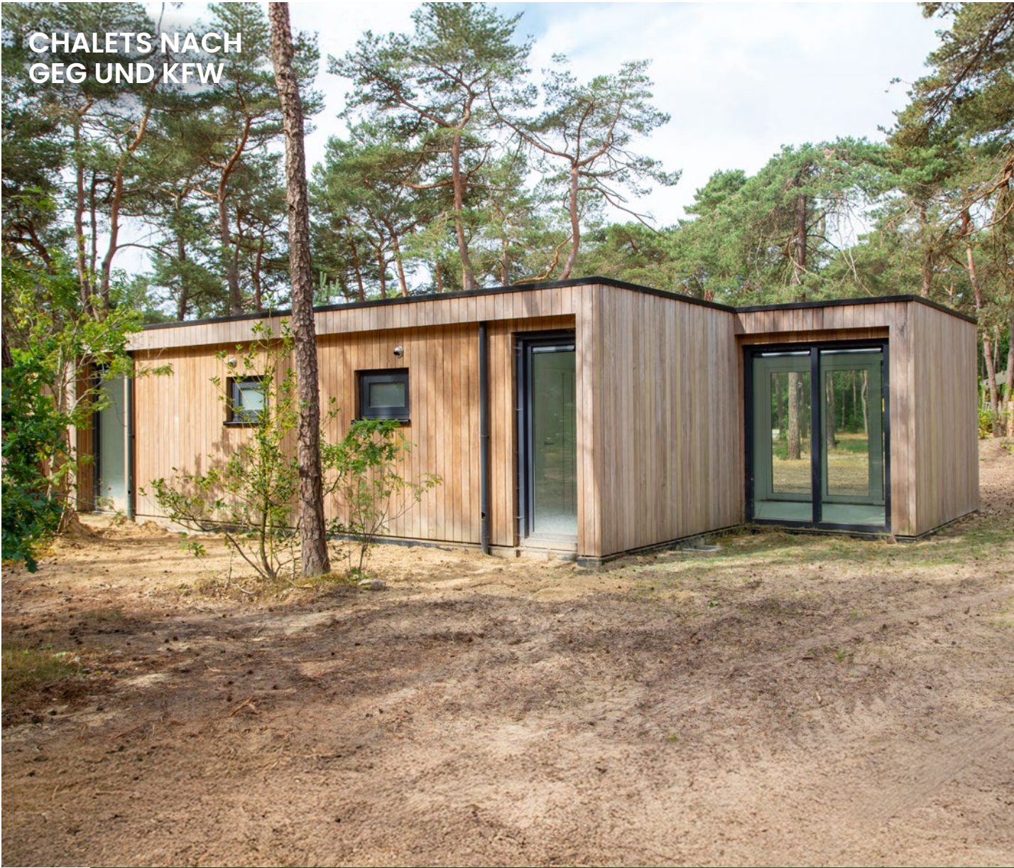
CHALETS NACH GEG UND KFW